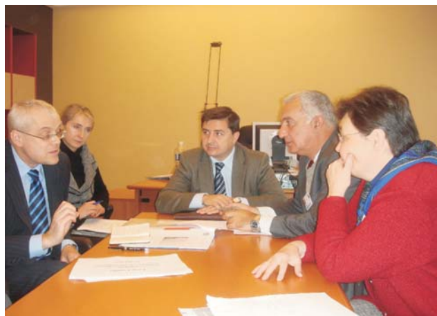
Direcção da ELFAC com o Comissário Europeu dos Assuntos Sociais Spidla

As mulheres que desejam ter três ou mais filhos são fortemente pressionadas para não os ter, nomeadamente no segredo das consultas nos serviços de saúde;