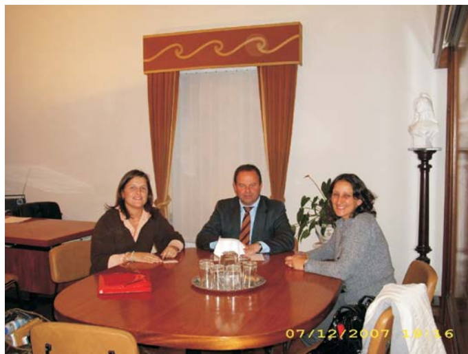
Agradecimento da implementação do Cartão de Família Numerosa ao Município de Tavira

No passado dia 24 de Novembro do ano que terminou, o Refúgio Aboim Ascensão recebeu as famílias numerosas do Algarve e a direcção da APFN num almoço convívio seguido de uma visita à instituição.