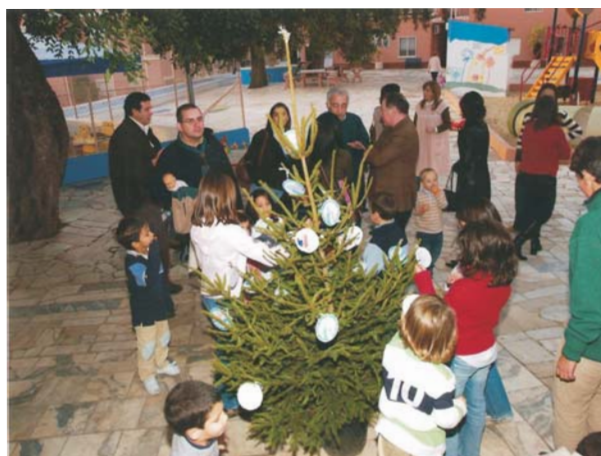
Enfeite da Árvore de Natal