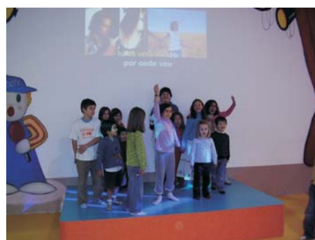
Karaoke e Castelos de Bolas na Dotylândia