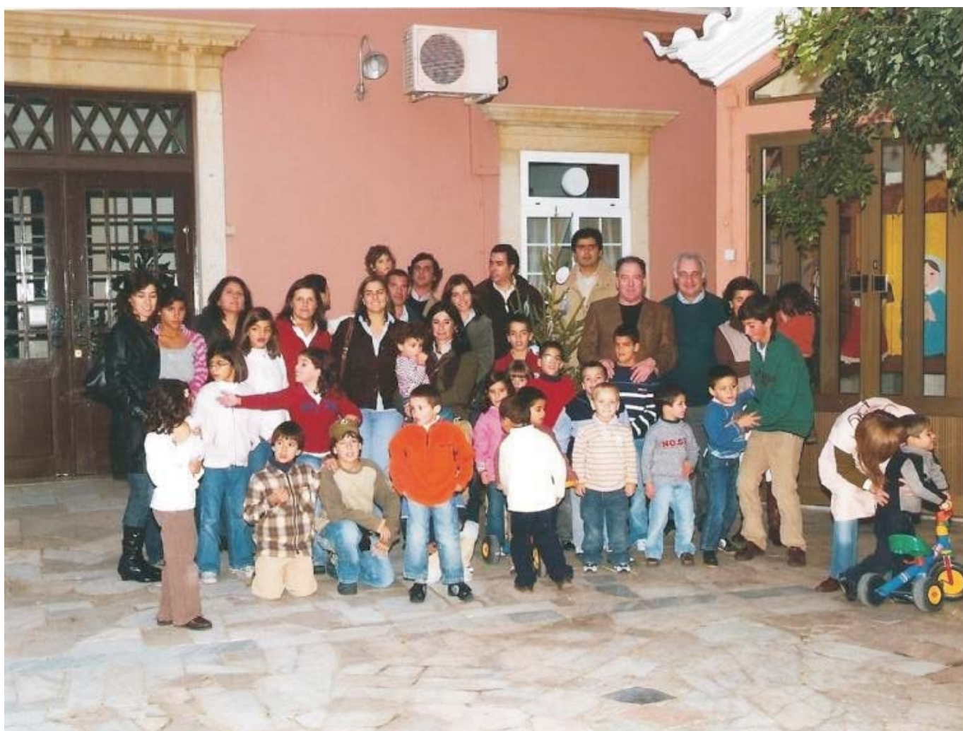
Uma visita ao Refúgio Aboim Ascensão

“A Família é a unidade fundamental da sociedade e tem a principal responsabilidade pela protecção, crescimento e desenvolvimento das crianças.” ONU - “Um mundo para as crianças é um mundo para a Família.” UNICEF