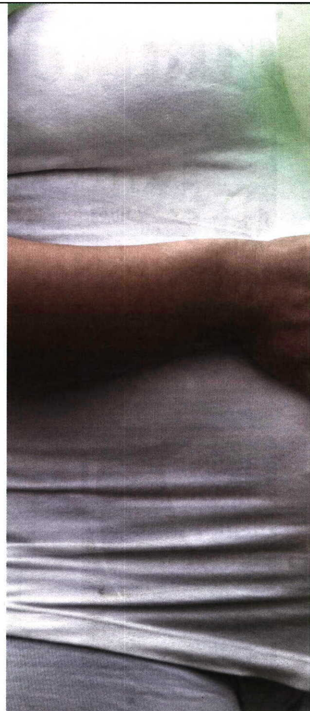
Abono pré-natal vai oscilar entre 32 e 132 euros mensais

Vieira da Silva quer contribuir para inverter maus índices de natalidade e apoio do Estado às famílias