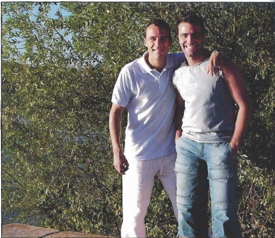
Os Anjos consideram que o seu relacionamento de irmãos é «espectacular». Os elos fraternais que os ligam fá-los sentir que são a «metade» um do outro.

Estas disputas ocasionais ou até, por vezes, muito frequentes entre irmãos não devem ser dramatizadas. Os miúdos riem e barafustam por tudo e por nada. As gargalhadas misturam-se com as zangas. Facilmente declaram guerra uns aos outros e apertam as mãos logo a seguir, baralhando os adultos. Estes comportamentos fazem parte do crescimento e não há motivo para alarme: «Os sentimentos de competição, rivalidade e algum ciúme fazem parte das relações ditas normais do sistema fraternal e por regra extinguem-se não comprometendo o relacionamento saudável,