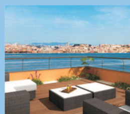
Fantásticos Terraços com vista sobre o Tejo e Lisboa em pleno Mar da Palha.