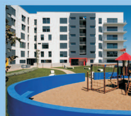
Luxuosos Condomínios Privados com Jardim e Equipamento Infantil privativos.