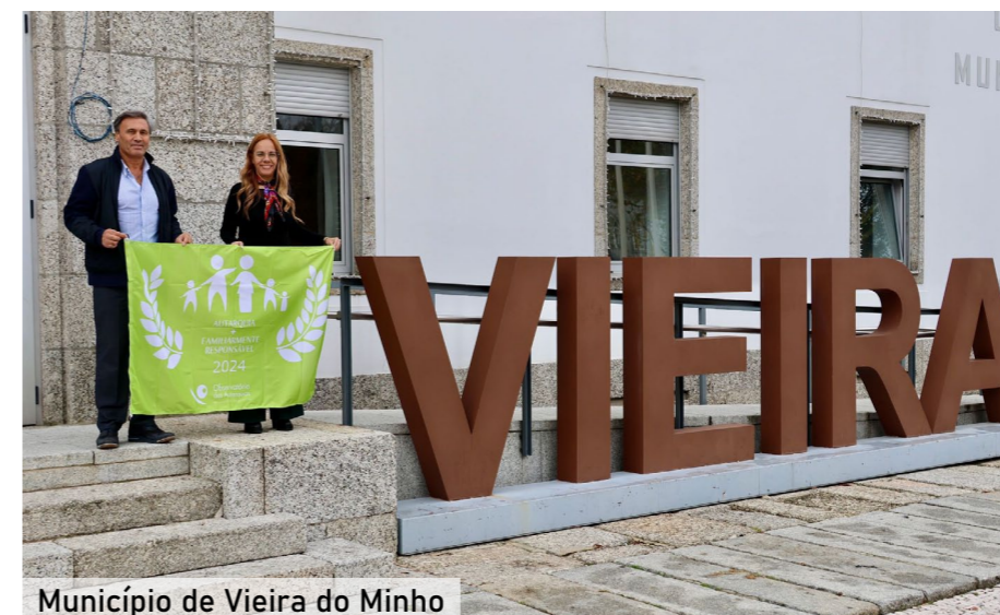
Município de Vieira do Minho