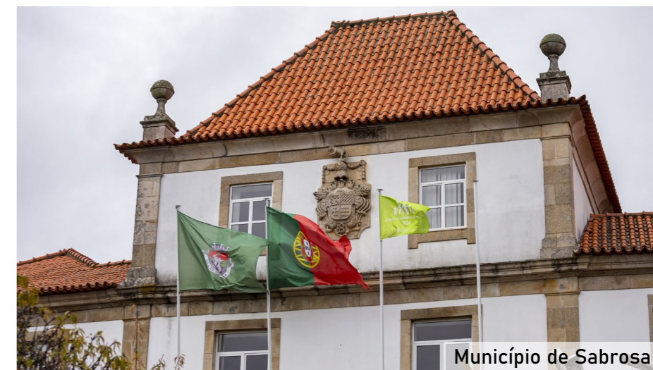
Município de Sabrosa

tem outras medidas que ajudam no orçamento familiar, nomeadamente os descontos nas taxas municipais que foram aplicados em 89 autarquias para as famílias com insuficiência económica, através do rendimento per capita, para portadores de deficiência, idosos ou em função do número de filhos, de acordo com os dados da 16ª edição do OAFR. Por exemplo, Pombal (distrito de Leiria) aprovou na tabela de taxas a possibilidade de dispensa ou redução do pagamento das taxas e de outras receitas municipais a pessoas singulares, nomeadamente, possibilidade de conceder uma redução de 5% a 20% aos utentes que demonstrem um agregado familiar numeroso (constituído por três ou mais filhos), mediante requerimento fundamentado. No apoio à saúde das famílias, destaca-se o apoio financeiro de despesas médicas das famílias no âmbito de tratamentos oftalmológicos em 75 autarquias premiadas e 106 municípios no