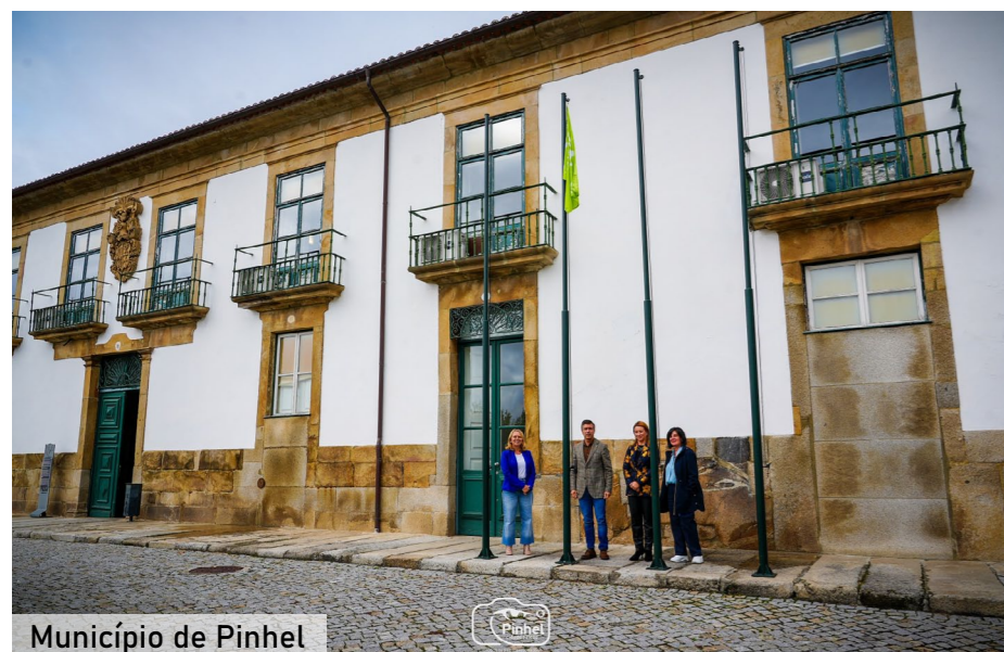
Município de Pinhel

tem outras medidas que ajudam no orçamento familiar, nomeadamente os descontos nas taxas municipais que foram aplicados em 89 autarquias para as famílias com insuficiência económica, através do rendimento per capita, para portadores de deficiência, idosos ou em função do número de filhos, de acordo com os dados da 16ª edição do OAFR. Por exemplo, Pombal (distrito de Leiria) aprovou na tabela de taxas a possibilidade de dispensa ou redução do pagamento das taxas e de outras receitas municipais a pessoas singulares, nomeadamente, possibilidade de conceder uma redução de 5% a 20% aos utentes que demonstrem um agregado familiar numeroso (constituído por três ou mais filhos), mediante requerimento fundamentado. No apoio à saúde das famílias, destaca-se o apoio financeiro de despesas médicas das famílias no âmbito de tratamentos oftalmológicos em 75 autarquias premiadas e 106 municípios no