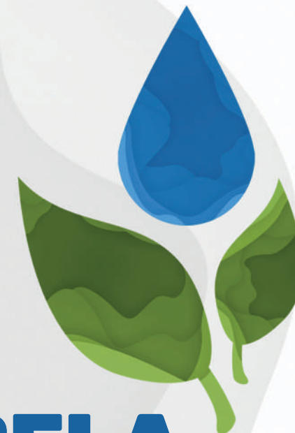
TABELA TARIFÁRIA 2020